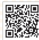
申込フォーム QRコード