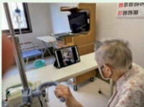
※オンライン面会の様子（許可を得て掲載しています）

当院ではこれからもデジタル機器に不慣れな方にも負担なく面会していただける方法など、引き続き検討を重ねていきたいと思っております。